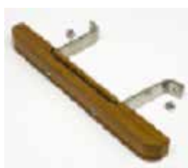
Ручка для гриля