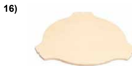
Керамический отсекаТЕЛЬ жара