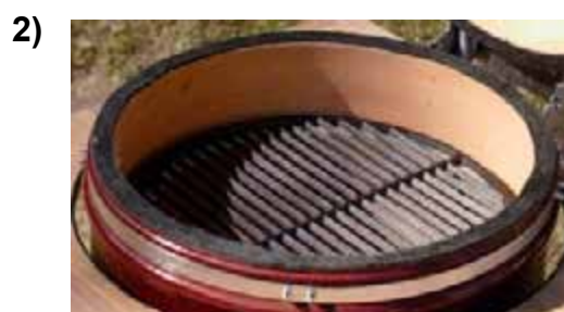
Чугунная решетка для гриля