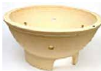
нижняя часть внутренней футеровки гриля (шамот)