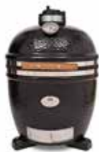
Гриль Monolith – корпус с крышкой (цвет красный или черный)