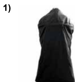
Защитный чехол из нейлона