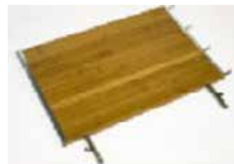
2 столика (бамбук)