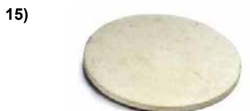
Керамический противень для пиццы