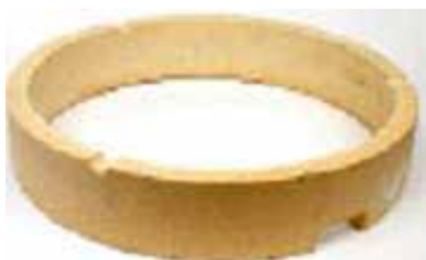
Верхняя часть внутренней футеровки гриля (шамот)