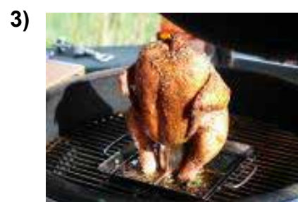
Подставка для курицы гриль