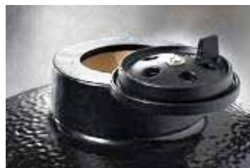
Крышка для регуляции подачи воздуха