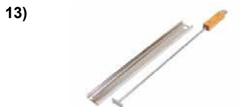
Направляющая для подачи в барбекю ароматной щепы для копчения