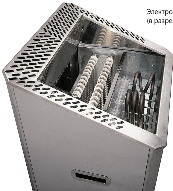
Электронагревательное устройство Лидия М (в разрезе, без верхней крышки)