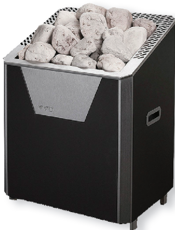
Рис.1а. Печь Лидия М в нержавеющей корпусе