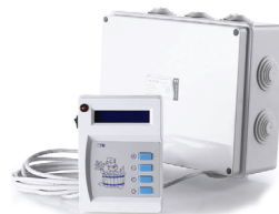
Рис.1в. Пульт Управления цифровой ПУ-01М