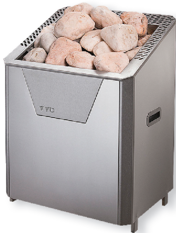
Рис.16. Печь Лидия М в стальном, окрашенном корпусе