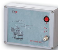
Рис.1г. Пульт управления аналоговый ПУ-03-М3