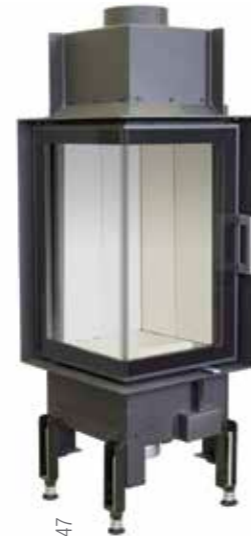
38x38x57K 2.0 - Art. no. 360147